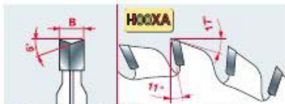
CARATTERISTICHE DEL DENTE - TOOTH'S FEATURES