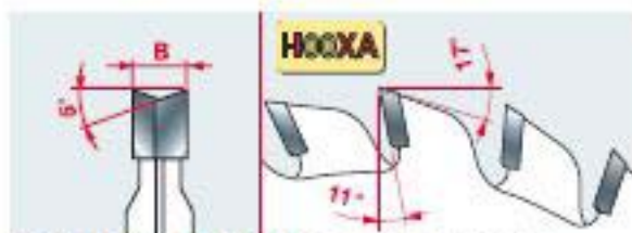
CARATTERISTICHE DEL DENTE - TOOTH'S FEATURES